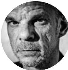
Denis Lavant © Luc Valigny

« Écrire ce livre c'est une forme de débauche, prolongée, concentrée, avec cette énorme différence que d'un bout à l'autre je me suis astreint à la vérité ! » Malcolm Lowry.