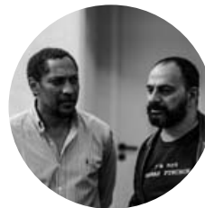
Everett-Claro

Déjouer les attentes du lecteur, s'emparer d'un genre pour le faire éclater, pousser le langage à son point de rupture, voilà ce qui lie l'auteur-traducteur Claro et l'écrivain américain Percival Everett. Romancier protéiforme, Percival Everett explore les possibilités offertes par le western, le polar ou l'autobiographie ( Effacement , Pas Sydney Poitier , Montée aux enfers ) pour en révéler les mécanismes dans un dévoilement toujours empreint d'ironie. Le rapport au langage est sans cesse mis en question, les mots se « cannibalisent », selon l'expression de Claro, lui-même traducteur d'une littérature américaine du débordement (Danielewski, Gass, Vollmann...). L'auteur de Livre XIX , CosmoZ , Madman Bovary aime à emmener le lecteur dans une traversée vertigineuse des lieux et des époques, son écriture explosive explorant les travers de l'âme humaine tout en faisant éclater les conventions romanesques. Dialogue autour de deux écritures hors-normes.