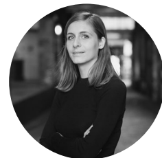
Eleanor Catton

Ce grand roman dickensien est un pastiche des romans d'aventures du XIX e siècle. En 1866, temps de la ruée vers l'or, des meurtres que personne ne parvient à résoudre ont été commis dans la petite communauté d'Hokitika. Les mystères s'accumulent lorsque le brillant Walter Moody débarque en Nouvelle-Zélande pour y faire fortune. Ample, complexe, envoûtant, le récit procède par strates imbriquées et fait preuve d'une maîtrise narrative rare.