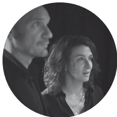
N. Lvovsky & G. Roussel

Ils sont « fans » l'un de l'autre. Elle : réalisatrice, scénariste et comédienne. Lui : auteur, compositeur et interprète. C'est d'ailleurs Gaëtan Roussel qui a signé la bande originale du dernier film de Noémie Lvovsky au succès amplement mérité, Camille redouble . L'un et l'autre en duo donc, face à face sur scène, dans une complicité évidente. Ordre du jour : leur bibliothèque et leur table de chevet. Une lecture à deux voix qui laisse une large place à la poésie (Yeats, Ghérasim Luca, Marina Tsvetaïeva...) en passant par le cinéma (Bergman). Un kaléidoscope de mots émaillé de chansons naturellement car, pour l'occasion, Gaëtan Roussel met en musique et en voix certains poèmes, de même qu'il reprend des morceaux de son propre répertoire. Une clôture marquante pour Paris En Toutes Lettres.