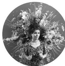
Klô Pelgag

Quand Klô Pelgag chante, les images s'animent. Inspirée par l'art visuel (Botero, Dali, Magritte), la littérature et le théâtre (Vian, Ionesco), le cinéma (André Forcier, Jean-Claude Lauzon) et la musique (Vigneault, Debussy, Brel, King Crimson, Zappa), Klô Pelgag s'efforce de faire de ses chansons un paysage pour les non-voyants. Pour que les mots n'existent pas sans la musique, et réciproquement.