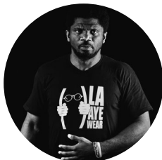
Gauz © D.R.

RDV à 10H devant la librairie Le Genre Urbain, 60 rue de Belleville (M o Belleville / Pyrénées)