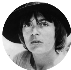
Monique Wittig

Cette soirée est organisée par l'association des Amies de Monique Wittig.