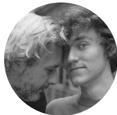
N.Rey et M.Saïkaly

En coproduction avec les Productions de l'Explorateur.