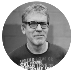
Dick Annegarn

Bien que néerlandais, Dick Annegarn est presque belge : une enfance qui s'est essentiellement déroulée à Bruxelles et une chanson inoubliable, Bruxelles . Depuis lors, il a été fait Citoyen d'Honneur de la ville et docteur honoris causa de l'Université de Liège.