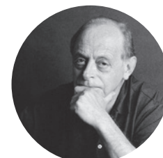
Antonio Tabucchi