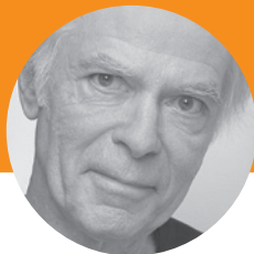
Pascal Quignard