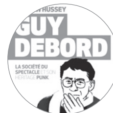
Guy Debord

À l'occasion du 20 e anniversaire de la mort de Guy Debord, paraît une biographie complète et vivante sur un personnage énigmatique, souvent méconnu bien que ses archives aient été classées trésor national en 2011.