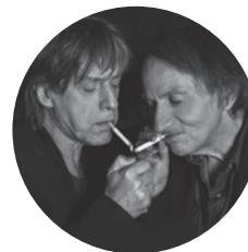
J.L. Aubert et M. Houellebecq

Avant le démarrage de sa tournée officielle dans toute la France, Jean-Louis Aubert sera sur scène avec Michel Houellebecq pour une performance unique.