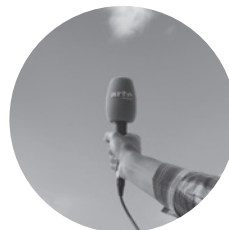
Arte Radio © Nicolas Bérart

Le goûter d'écoute mensuel d'ARTE Radio : une heure pour découvrir une sélection de documentaires et créations sonores, les yeux ouverts ou fermés. Des courts-métrages audio de 2 à 30 minutes, ludiques, politiques ou érotiques, présentés par les auteurs et l'équipe d'ARTE Radio. Le rendez-vous du « cinéma pour les oreilles », un dimanche par mois et qui se prolonge autour d'un goûter.