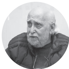
Jerome Rothenberg

Khurbn est le pendant de Pologne / 1931 , un autre livre de Jerome Rothenberg paru aux éditions Caractères l'année dernière. Il aura ainsi revisité deux faces de la Pologne, terre d'origine du poète né en 1931. Dans Pologne / 31 , il s'agit d'un pays imaginé, nourri exclusivement d'anecdotes familiales, de lectures, de kabbale, de Mishna, de fantasmes, alors que Khurbn est le livre du retour physique dans la petite ville polonaise de d'Ostrow-Mazowiecka. Khurbn signifie « destruction totale » en yiddish. Le retour dans la terre de ses ancêtres permet au poète de mesurer l'ampleur de l'anéantissement après la Deuxième Guerre mondiale et la Shoah.