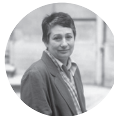
Ludmila Oulitskaïa