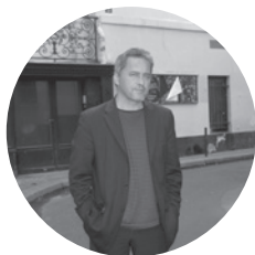
Manuel Rivas

Comme dans ses romans précédents, Rivas excelle dans la peinture de la Galice profonde, l'inscrivant cette fois dans la marche vers la modernité et la mondialisation.